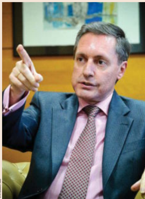
Santiago Menéndez, director de la Agencia Tributaria.

impuesto (ver gráfico adjunto). Así, la Comisión Europea publicó ayer un análisis sobre España, en el que insta a subir los ingresos por IVA, como adelantó EXPANSIÓN. Bruselas pide que se suba el impuesto colocando productos ahora en los tipos reducidos en el general, lo que España no contempla, de ahí la importancia de reducir el fraude